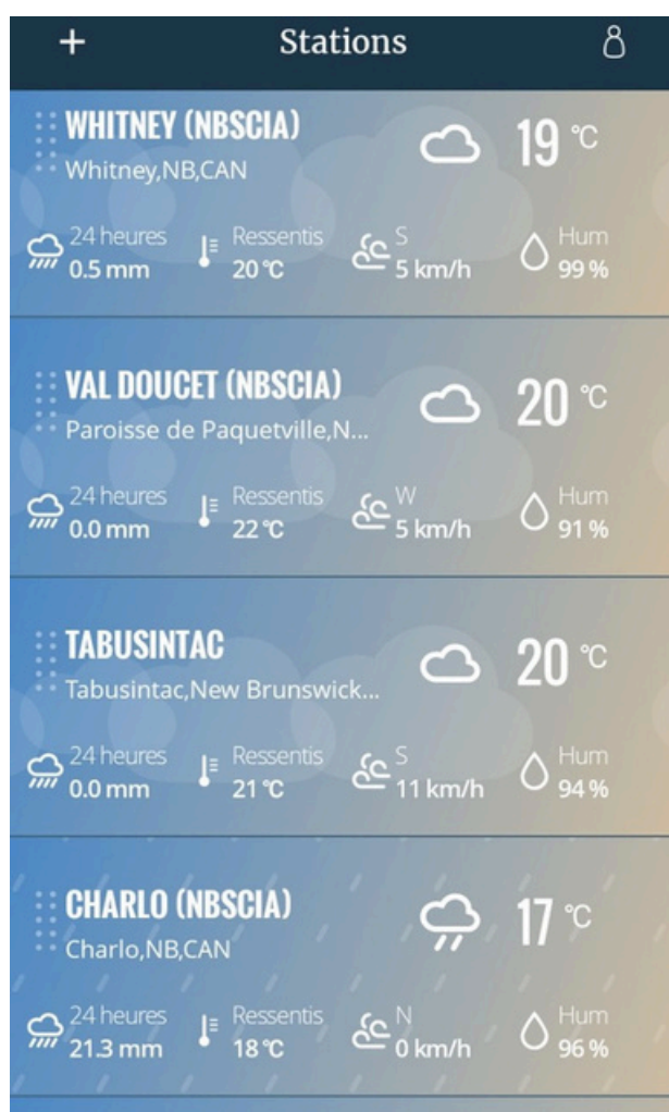
L'écran d'accueil de WeatherLink