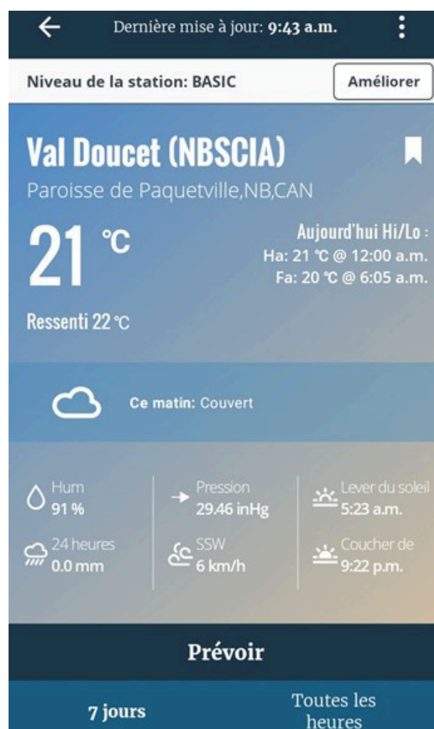
Un examen plus approfondi des données d'une station

Contactez votre coordinateur de l'AASCNB pour voir les données de température du sol des stations de l'AASCNB et pour obtenir de l'aide avec l'application.